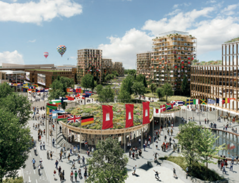
Visualisierungen Copyright: Cobe